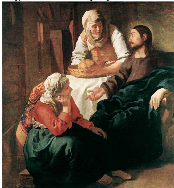
Johannes Vermeer: Krisztus Mária és Márta házában