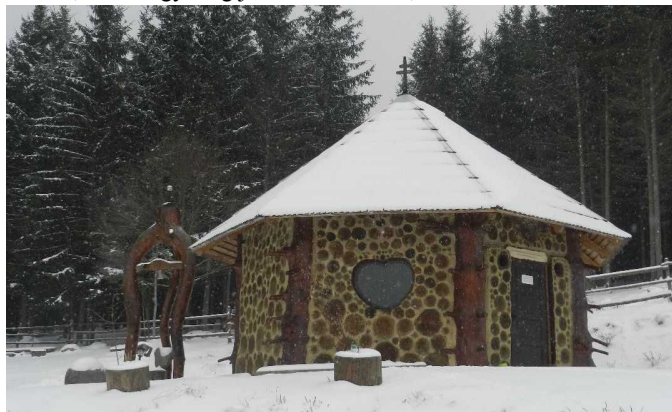
Csinódi Gyümölcsoltó Boldogasszony kápolna 2020 március 25.-én

Kérkedni valamiféle tudással, hatalommal, lenézni a másikat, aki nem gazdag, szép, diplomás, fehér, sárga, vagy fekete. Hajtunk, hogy pénzünk legyen, még és még és annál is több. Ezért elhagyjuk idős szüleinket, hazánkat, szülőföldünket és a világ túloldalára költözünk, csak hogy még jobban élhessünk, másokkal nem törődve.