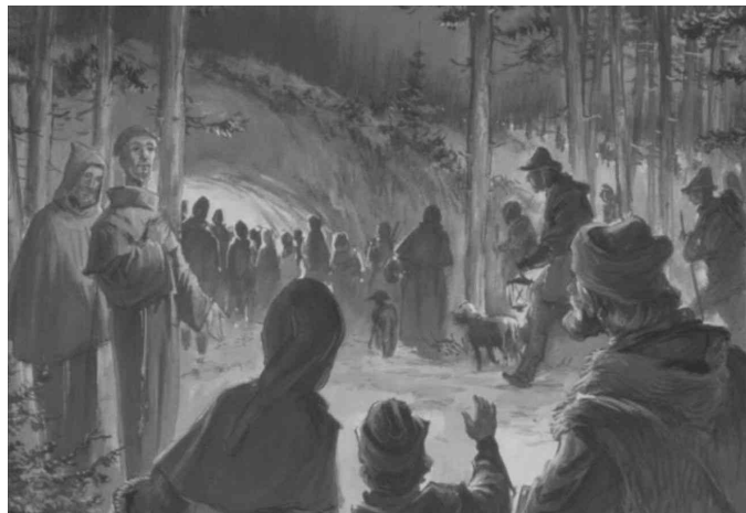
Assisi Szent Ferenc barlangja Greccióban

1223. karácsonyát Assisi Szent Ferenc úgy akarta megünnepelni Greccióban (ejtsd: Gréccsó), hogy testi szemével is láthassa a betlehemi barlangot az újszülött Kis Jézussal, a Szűzanyával és Szent Józseffel. Celanói (ejtsd: Csélánói) Tamás, Szent Ferenc egyik első követője és életrajzírója így emlékezik meg az eseményről: „ Boldogságos Ferenc, mint már azelőtt is többször megtette, karácsony előtt vagy tizenöt nappal magához hívatta János urat, és így szólt hozzá: 'Ha azt akarod, hogy az Úr közelgő ünnepét Greccióban üljük meg, úgy siess, és szorgalmasan tégy meg mindent, amit mondok neked! Meg akarom ugyanis eleveníteni a betlehemi kisdéd emlékezetét, és tulajdon testi szemimmal akarom szemlélni gyermeki korlátoltságának kényelmetlenségeit, látni akarom, hogyan helyeztetett a jászolba és hogyan feküdt az ökrök és a szamar előtt a szénán.' A derék és hűséges ember a parancs hallatára elsielt, és a kitűzött helyen előkészített mindent, amit a szent kívánt tőle... Készen állott a jászol, ott volt a széna, odavezették az ökröt és a szamarat. Ünnepezt itt az egyszerűség, vigadozott a szegénység, felmagasztaltatt az alázatosság, és Greccio mintegy új Betlehemmé alakult át. ” (Szent Ferenc első életrajza, XXX. Fejezet, Újvidék-Szeged-Csíksomlyó 1993,91.)