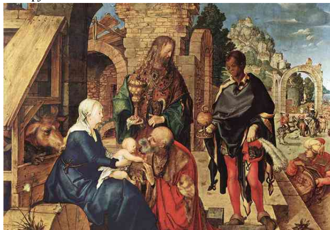
Albrecht Dürer: A három királyok imádása

Karácsony napján rövid fegyverszünet, aztán jöhetnek ismét a feszültségekkel teli hétköznapiak, a megszokott élet. Ezek a karácsonyi és egy nappal karácsony utáni történetek arra hívnak bennünket, hogy karácsonytól karácsonyig odafigyeljünk kik azok, akik számára nem zsugorodott össze egyetlen estére a karácsony. Akik a szürke, feketebetűs hétköznapiakon is mindent elkövetnek, hogy szeretetet adjanak és kapjanak.