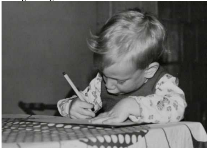
Az okos ember mindentől tanul.

– Hogy vagy Te tartod ellenőrzés alatt a tetteidet, vagy azok fognak Téged.