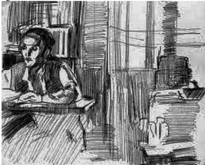
Készülni a Krisztussal való találkozásra

Fiam, ami értékes gondolatot ezek a keleti világfelfogások nekünk adhatnak, mindaz megvan és sokkal világosabban megvan Krisztus vallásában; ami meg amazoknál új és eltérő dolog, az mind sejtelmes homály, sötét köd vagy világos tévedés.