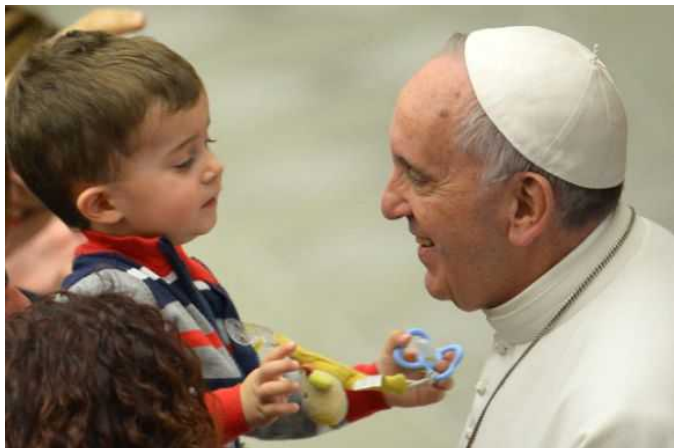
A pápa szeretettel válaszol a gyerekek kérdéseire

méltóságot megalázó és eltorzító nélkülözésben, mert hiszen közösséget vállalnak egymással: közös a szívük. Szeretik egymást! Ez jelzi kereszténységünk valóságát: a konkrét szeretet!