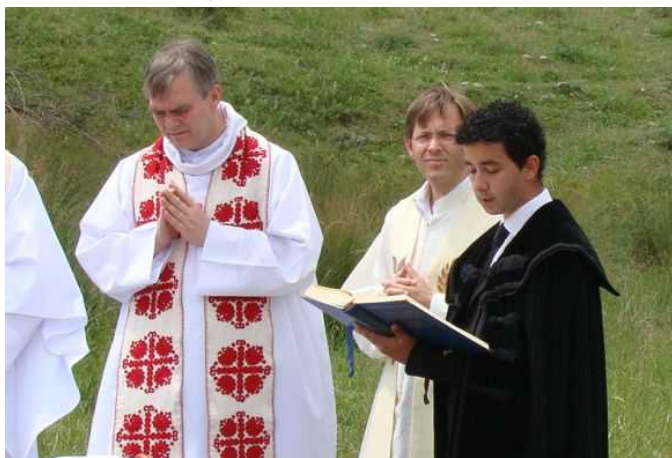
Olvasmány Szent László kútjánál

Fontos a lelki élet szempontjából is. Isten a fejlődés elvét érvényesítette mindenben. Ezt megtaláljuk az embernél is, nemcsak testi, de lelki vonatkozásban is. A lelki fejlődés szempontjából nagyon nagy szükség van az Ószövetségre, úgy, mint ahogy az embernek szüksége van a gyermekkorra s még felnőttkorában is a gyermekkor emlékeire, élményeire.