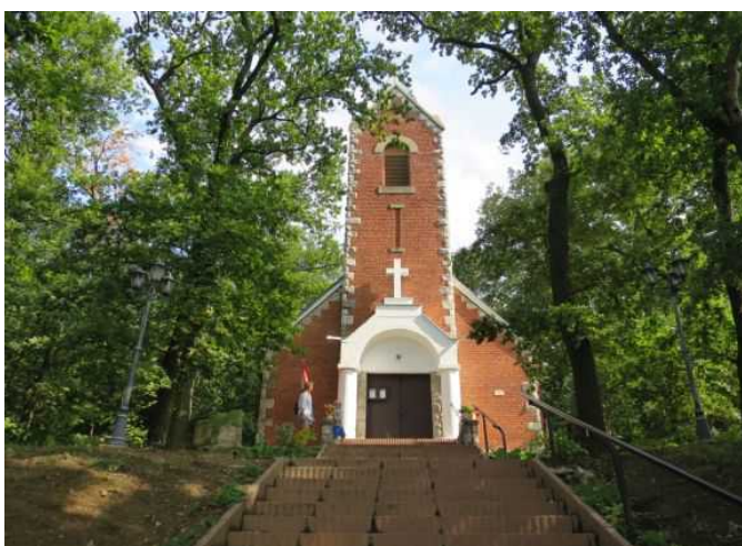
A keresztény ember úton van.