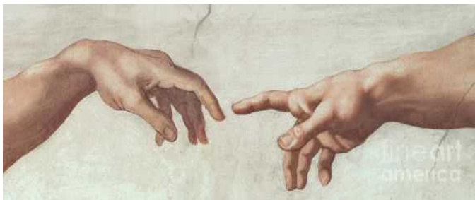
Michelangelo – A teremtés – Isten és Ádám keze – Sixtusi kápolna

A végső, első ok, Isten, aki létrehozta a másodlagos okot, a természetet. A két ok összefonódva hat, mint egyetlen princípium. A jó Isten teremtőkké teszi teremtményeit. Mindent Istent tesz és mindent a teremtmény más más szinten (kegyelem és szabadság). A végpont a feltámadt és megdicsőült Krisztus. Benne teremtett minden, benne áll fenn és Őhöz vezet: „ Ő a láthatatlan Isten képmása, minden teremtmény elsőszülötte. Mert benne teremtett mindent a mennyben és a földön: a láthatókat és a láthatatlanokat, a trónusokat, uralmakat, fejedelemségeket és hatalmasságokat. Mindent általa és érte teremtett. Ő előbb van mindennél, és minden benne áll fenn. Ő a testnek, az Egyháznak a feje. Ő a kezdet, az elsőszülött a halottak közül, hogy övé legyen az elsőség mindenben. Úgy tetszett (az Atyának), hogy benne lakjék az egész teljesség, s hogy általa békítsen ki magával mindent a földön és a mennyben, minthogy Ő a kereszten vérével békességet szerzett. ” (Kol 1,15-20)